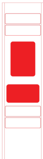
remoteLocker 100-sentral enhet med 4 rom

*Minste installasjon er 1 stk. 100- og 2 stk. 110-enheter.