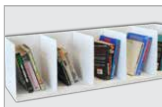
Kleine boeken Geschikt voor maximaal 50 artikelen