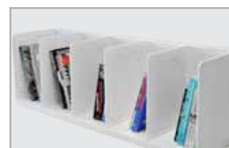
Grote Boeken Geschikt voor maximaal 50 artikelen