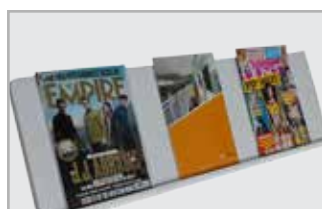
Tijdschriften en vakbladen Geschikt voor maximaal 4 artikelen

Mix en match vier verschillende soorten planken die bij uw bibliotheek passen. Hoewel meubilair niet wordt geleverd als onderdeel van dit product, bieden wij 3D tekeningen en specificaties om ervoor te zorgen dat alle op maat gemaakte meubilair perfect is ontworpen om bij uw gewenste planken te passen.