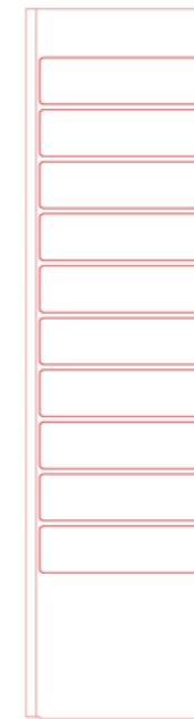
remoteLocker™ 110 10

图书馆可以发挥创意并从200多种颜色选项中选择, 以便和周围事物结合在一起。常规图案包装也是推广您图书馆品牌的一种流行方式。