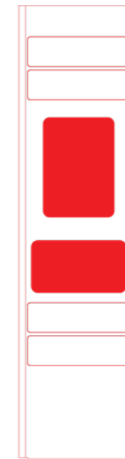
remoteLocker™ 100 包含4个锁柜的中央 单元