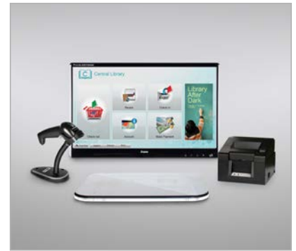
selfCheck™ components RFID (separate Aufstellung)