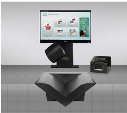
hybrid selfCheck™ components (eingebaute Version)

Unsere Lösungen, egal ob Barcode, RFID oder Hybrid, schneiden wir flexibel auf Ihre Anforderungen zu.