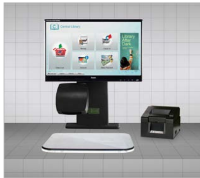
selfCheck™ components RFID (eingebaute Version)