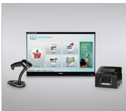
selfCheck™ components barcode (separate Aufstellung)